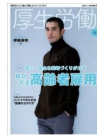
(株)日本医療企画 「厚生労働」2020年2月号

※1 (独)高齢・障害・求職者支援機構が発行する「高齢者雇用の総合誌 エルダー」、 (公財)産業雇用安定センターが発行する「失業なき労働移動のかけはし」 (独)労働政策研究・研修機構が発行する「Business Labor Trend」など